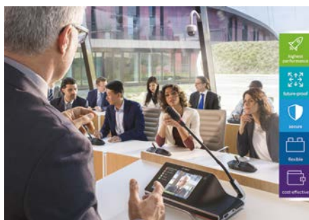
Συνεδριακά & Μεταφραστικά Συστήματα