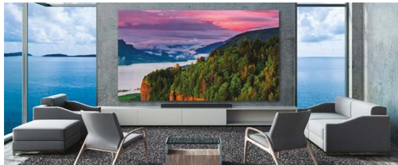
Led Walls (In / Outdoor)

Παρέχουμε ολοκληρωμένες οπτικοακουστικές λύσεις και υπηρεσίες για κάθε επαγγελματικό χώρο.