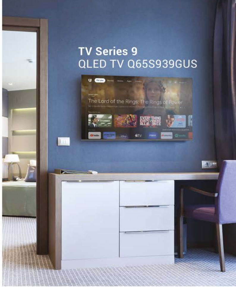
TV Series 9 QLED TV Q65S939GUS