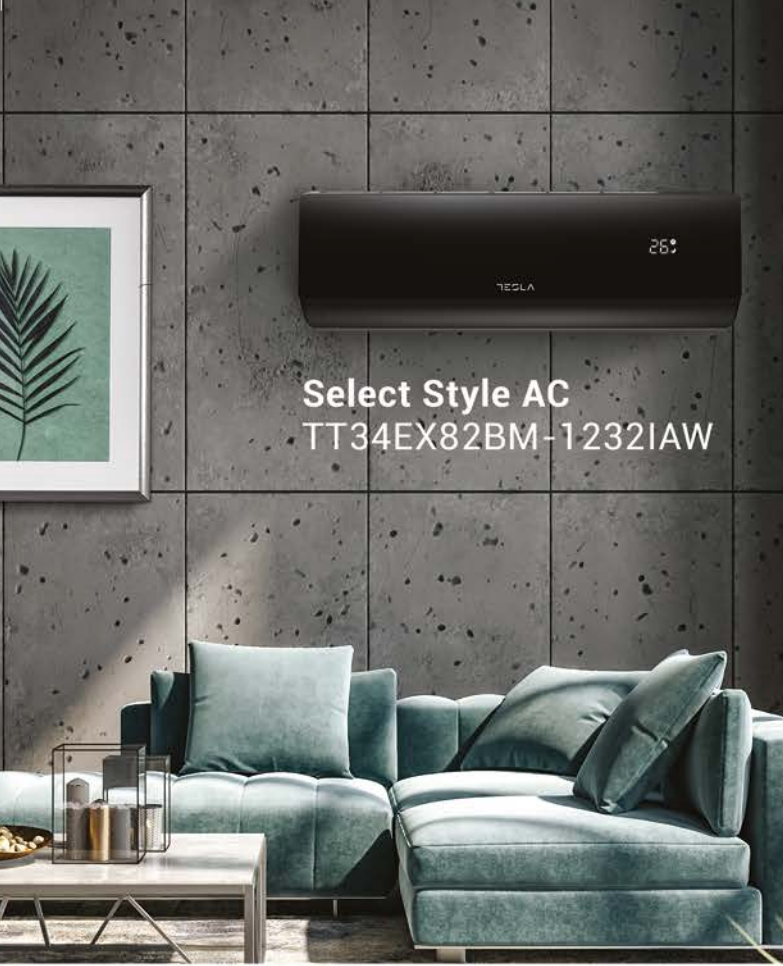
Select Style AC TT34EX82BM-1232IAW